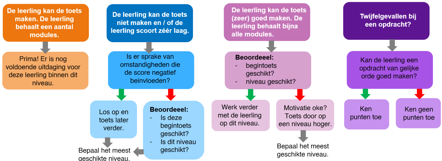
Figuur: kijkwijzer begintoets

NB: de begintoets is een hulpmiddel om het startniveau van de leerling te bepalen, en geen afrekenmodel!